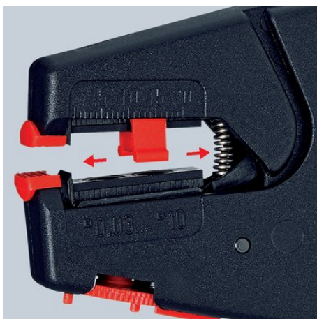
12 40 200: Tope longitudinal ajustable

Reservado el derecho a realizar modificaciones técnicas. Salvo error u omisión.